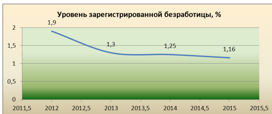
Рисунок 2 Уровень зарегистрированной безработицы за 2012-2015гг.

За 2012-2015 годы уровень безработицы на территории района имеет следующую динамику.