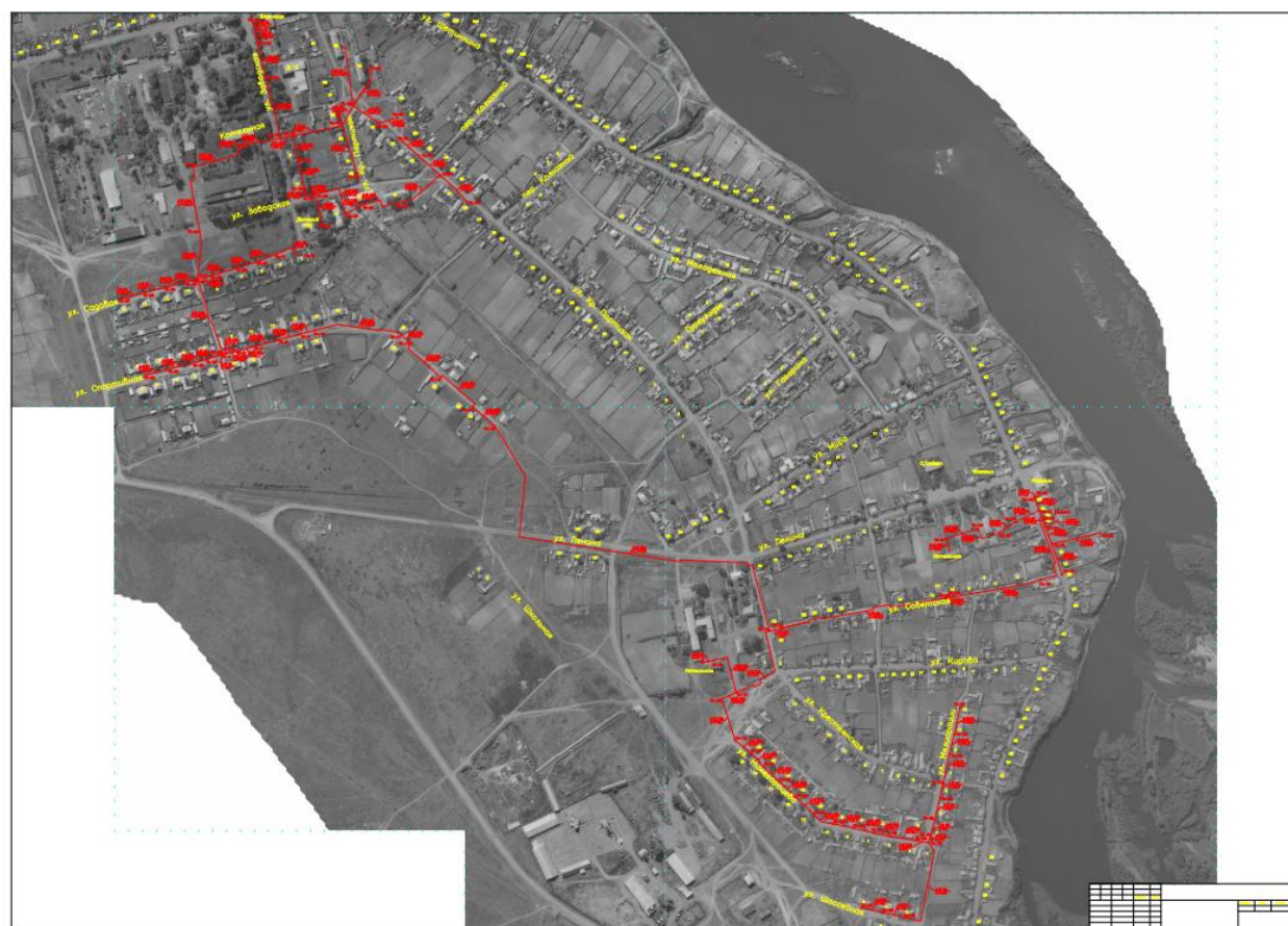
Схема теплоснабжения с. Городок

В настоящее время на территории Городокского сельского совета бесхозяйных тепловых сетей не выявлено.