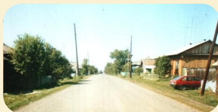
ул. Кретова в с. Малая Ничка