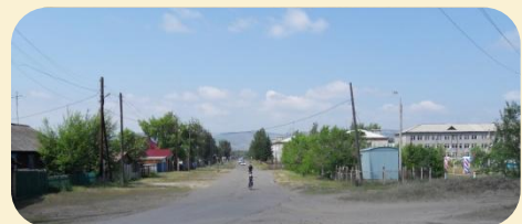
ул. Кретова в с. Селиваниха