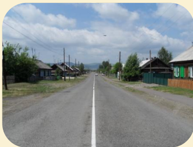
ул. Ленина в с. Селиваниха

Ленин - партийный псевдоним Владимира Ильича Ульянова. Российский и советский политический и государственный деятель мирового масштаба, революционер, создатель Российской социал-демократической рабочей партии (большевиков), один из организаторов и руководителей Октябрьской революции 1917 года в России, председатель Совета Народных Комиссаров (правительства) РСФСР, создатель первого в мировой истории социалистического государства - СССР.