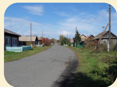
ул. Ленина в с. Большая Ничка

Киров Сергей Миронович - советский государственный и политический деятель. Первый секретарь Ленинградского областного комитета ВКП(б) и член Политбюро ЦК ВКП(б). член Политбюро, затем секретарь ЦК ВКП(б). Убит 1 декабря 1934 г. в Смольном.