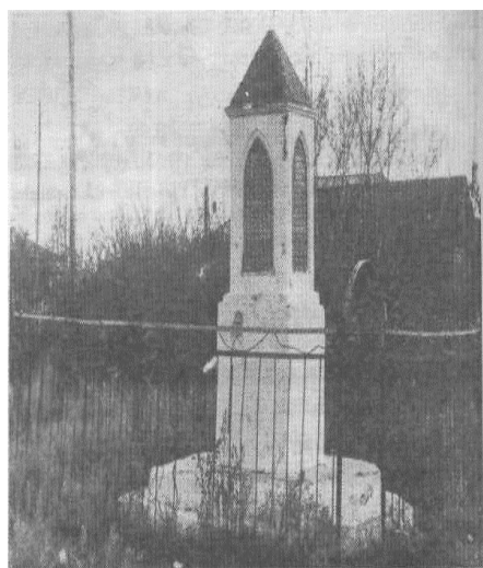
Фото 1980-х гг.

После освобождения от белогвардейцев в 1920 г. на могиле был сложен из кирпича обелиск. В конце 1960-х гг. сооружено бетонное надгробие, представляющее собой трехчастный (нижние две части в форме прямоугольного параллелепипеда, верхняя - пирамидальной формы) обелиск, увенчанный объемной металлической звездой, на бетонном стилобате в форме прямоугольного параллелепипеда.