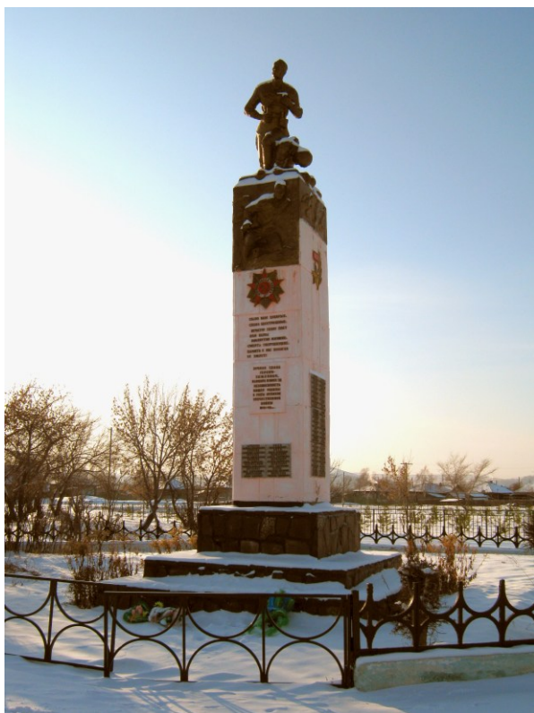
Обелиск в селе Кавказском

Подхожу душой в смятении К обелиску средь села, Читаю с трепетным волнением Мне дорогие имена. Полжизни вместе, всех их знаю, Передо мной они сейчас С гнетущим сердцем вспоминаю, Их, не вернувшихся с войны. Одни и жизнь не испытали, Другие только в жизнь вошли. И все они на поле брани Сложили головы свои. Какими горькими слезами Омыт уход из жизни их, Печаль не улеглась с годами На поколении живых. Идете мимо обелиска, Он, как они, безмолвно тих, Так поклонитесь ему низко И светлой памяти о них