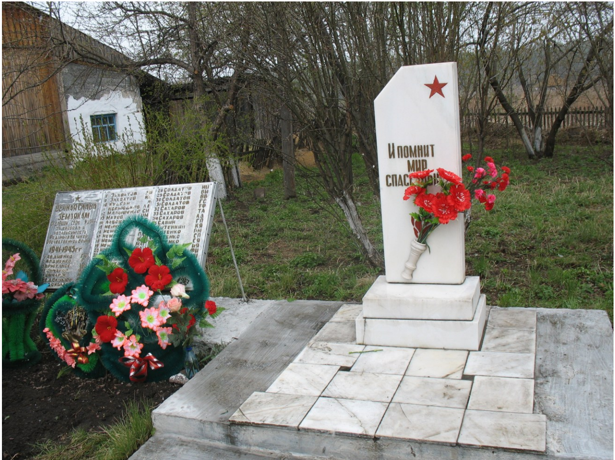
2011 г.