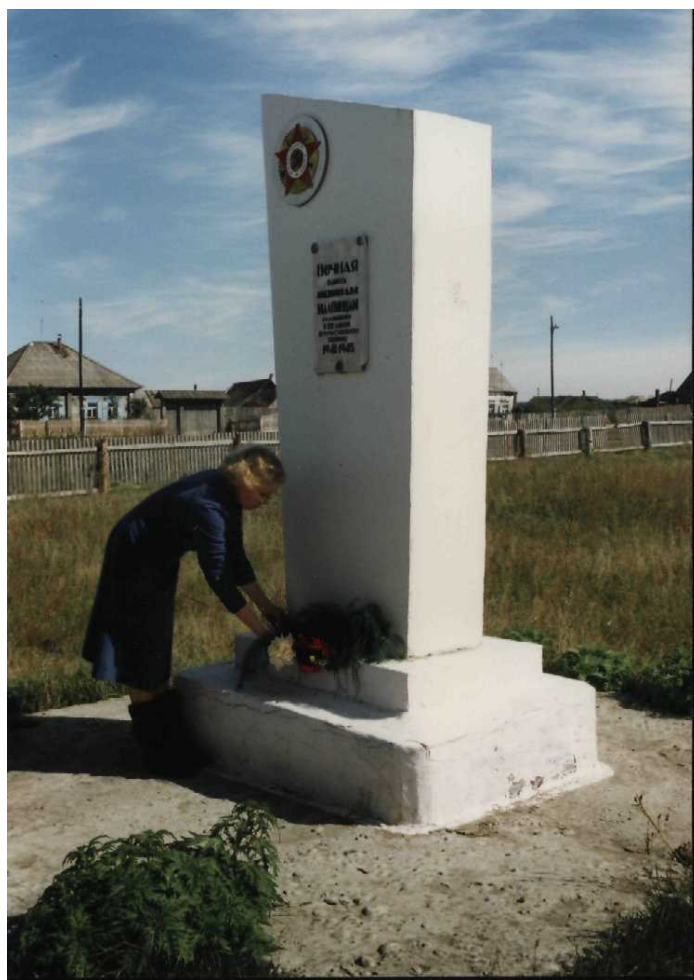
Фото . 2009 г.