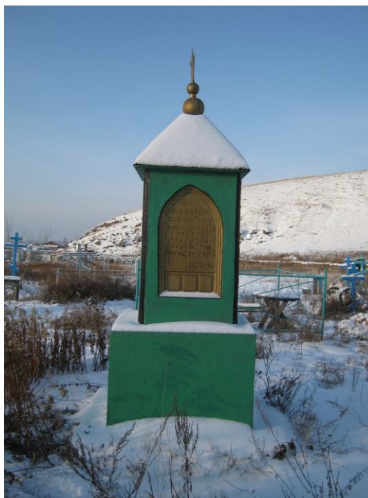
Фото 2010 г.

Высота памятника – 2,5 м: нижней части обелиска – 1,1 м, площадь основания – 1 х 1 м; высота средней части – 0,6 м, высота верхней части - 0,6 м,