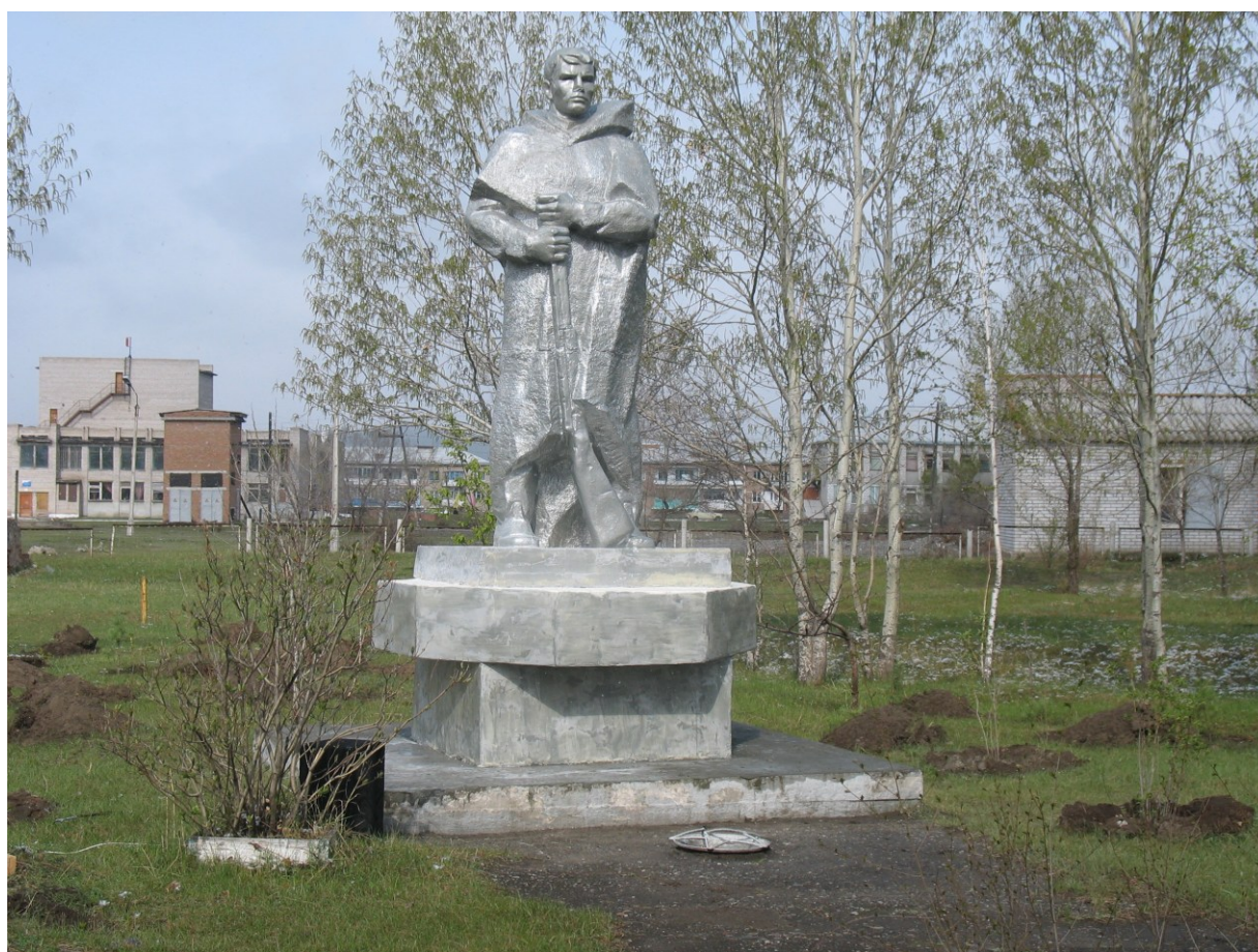
Фото . Май 2011 г.