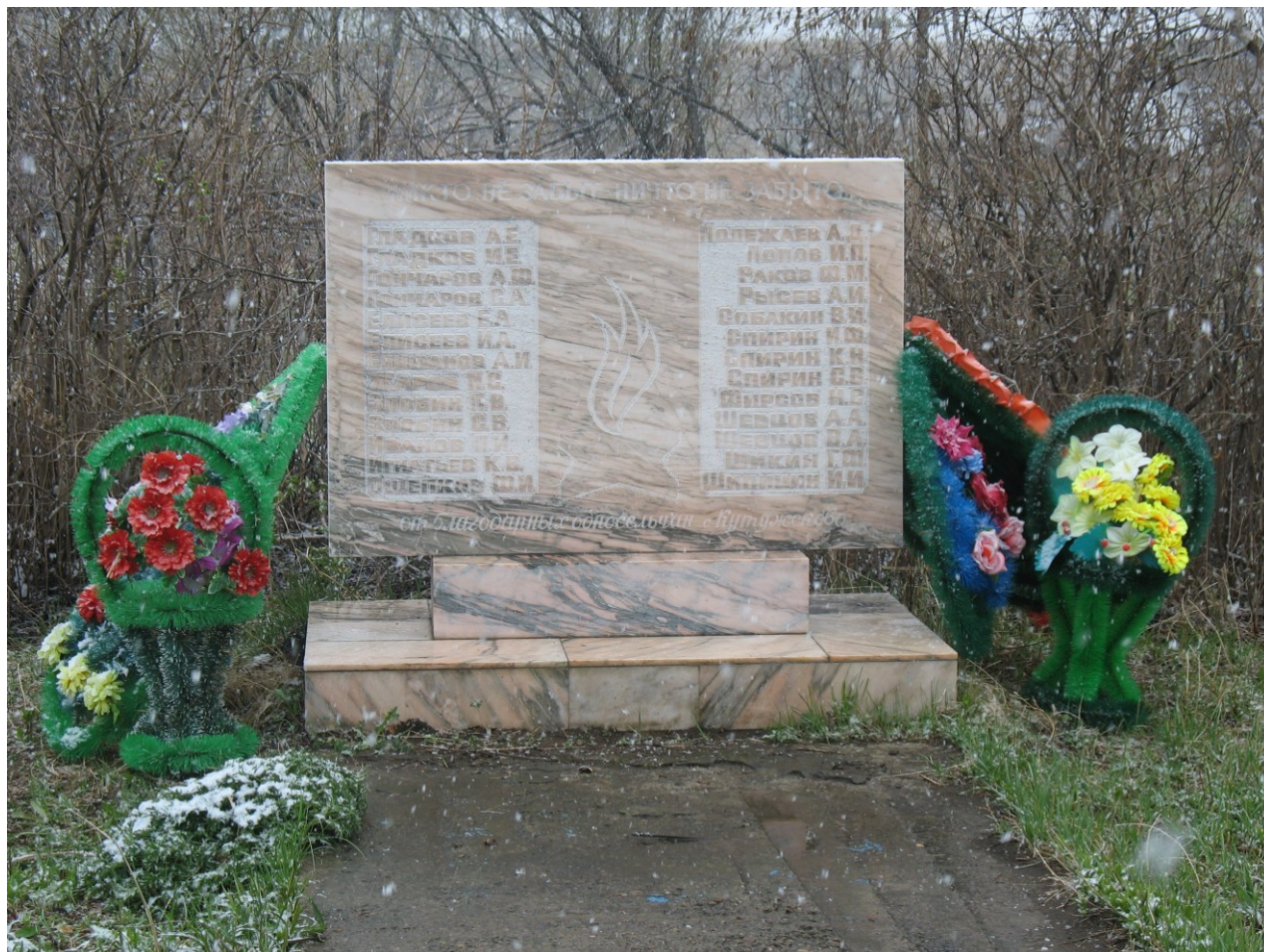
2011 г.