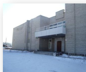
Районный Дом культуры, с. Селиваниха

16 декабря 2007 г. открыто новое здание сельского Дома культуры на 120 мест в с. Прихолмье