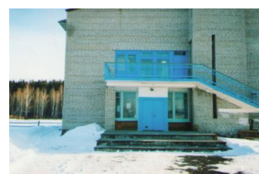
СДК в с. Верхняя Коя

31 декабря 1988 г. сданы в эксплуатацию : Дом культуры в с. Лугавское, клуб и детский сад в с. Верхняя Коя