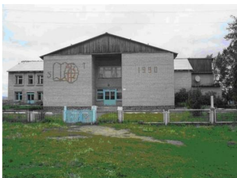
Школа в Притубинском

16 декабря 1997 г. приняты в эксплуатацию новые здания школ в п. Притубинский, с. Шошино, Дом культуры в с. Селиваниха