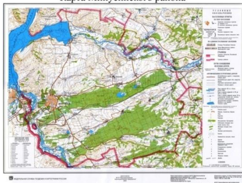
Карта Минусинского района

4 апреля 1924 г. приказом Енисейского губернского исполкома образован Минусинский район, центром которого стал г. Минусинск. Практически райисполком приступил к работе с 1 апреля, юридически существовал с 26 марта, когда состоялся 1 районный съезд Советов, избравший районный исполнительный комитет (РИК). Первым председателем стал З. К. Примаков, 27 летний крестьянин. Район был образован из 91 селения шести бывших волостей. Население составляло 44 450 чел. Сейчас в 34 населенных пунктах района проживает 27, 5 тыс. чел.