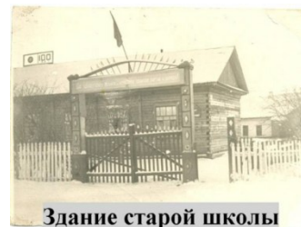
Здание старой школы

1 августа 1904 г. в с. Шошино по приговору сельского общества открыта школа. Занятия начались только 5 ноября. В 1906 г. было построено здание для школы. В 1991 г. для средней школы выстроено современное двухэтажное здание.