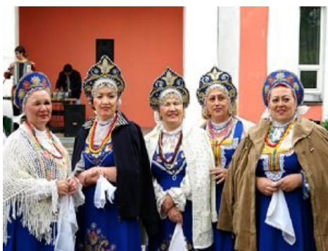
Фото: Русский народный хор им. Шрамко, г. Абакан, 2011