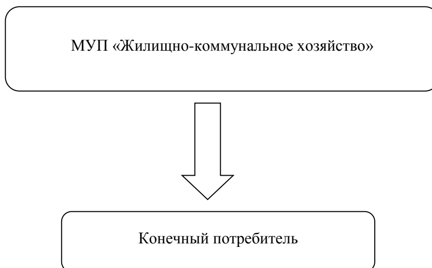
Рис.1.1 Функциональная схема централизованного теплоснабжения с. Малая Минуса

Функциональная схема централизованного теплоснабжения села Малая Минуса представлена на рисунке 1.1.