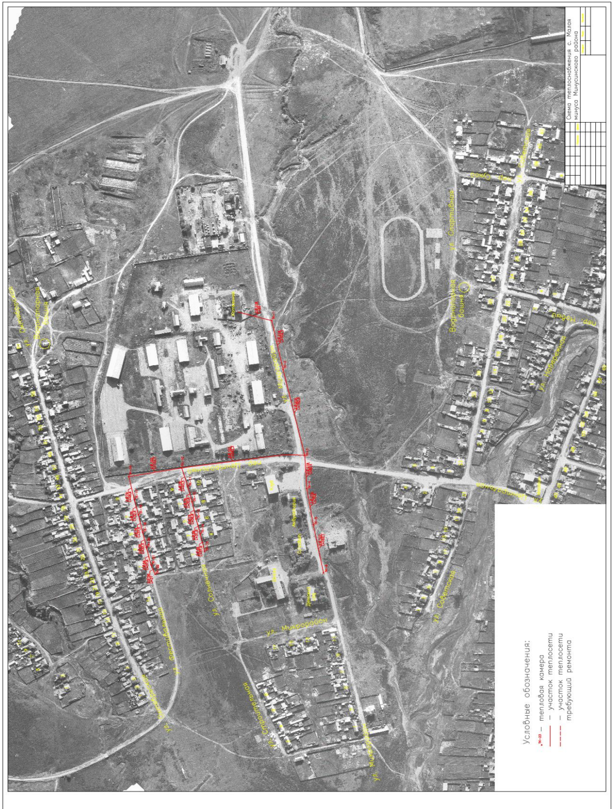
Схема теплоснабжения с. Малая Минуса

И.о. директора МКУ «Служба заказчика» Минусинского района